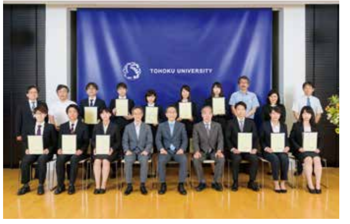
令和元年度 第1回グローバルリーダー認定証授与式

グローバルリーダーに認定されたTGL学生には、毎年2回開催される授与式にて、東北大学総長からグローバルリーダー認定証が授与されます。グローバルリーダー認定証は、在学中の海外留学や積極的な学びの姿勢などさまざまな取り組みが評価され、国際社会を牽引するリーダーとしての基礎的な能力を兼ね備えた学生であることを本学が認定した証明となります。