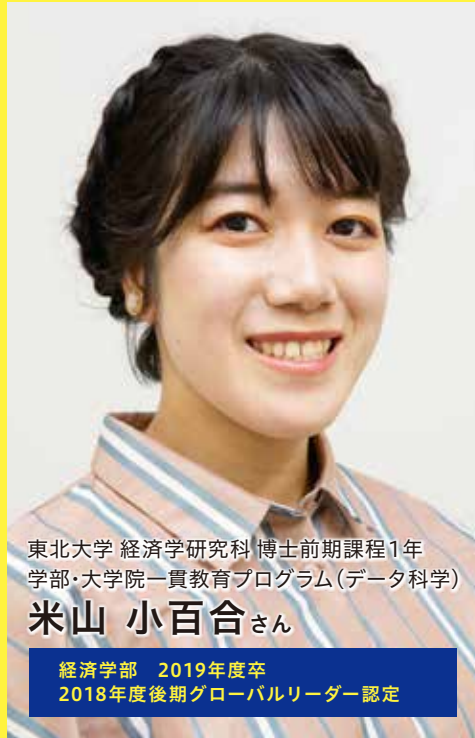
東北大学 経済学研究科 博士前期課程1年 学部・大学院一貫教育プログラム(データ科学)