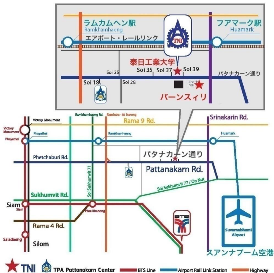
【泰日工業大学(TNI)とバーンスイリの地図】