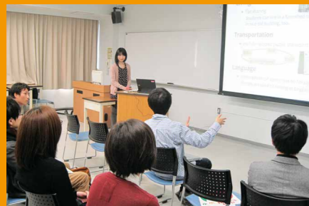
英語プレゼンテーション授業