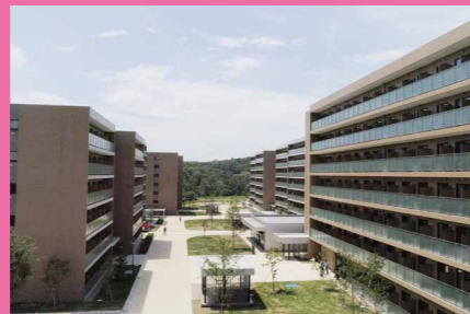
ユニバーシティ・ハウス