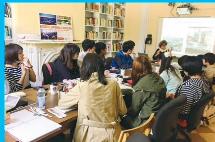
ファカルティレッドプログラム (FL)