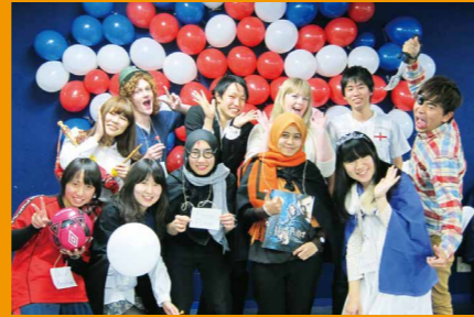
外国人留学生と共に学ぶ授業