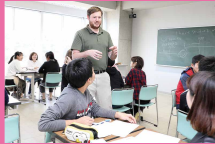
Tohoku University English Academy (TEA)