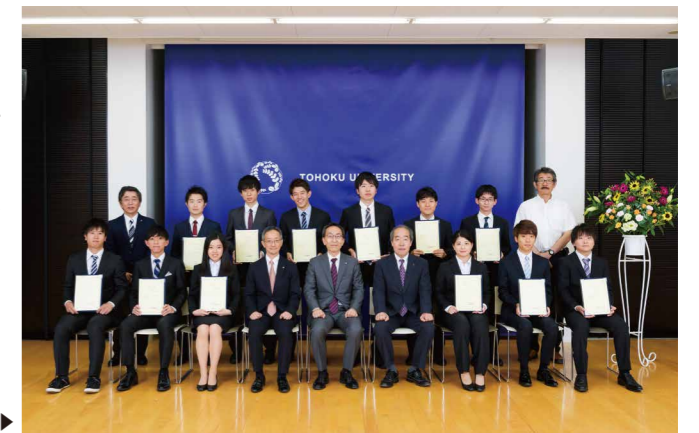
平成30年度 第1回グローバルリーダー認定証授与式▶

グローバルリーダーに認定されたTGL学生には、毎年2回開催される授与式にて、東北大学総長からグローバルリーダー認定証が授与されます。グローバルリーダー認定証は、在学中の海外留学や積極的な学びの姿勢などさまざまな取り組みが評価され、国際社会を牽引するリーダーとしての基礎的な能力を兼ね備えた学生であることを本学が認定した証明となります。