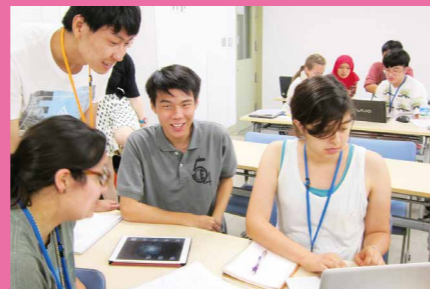
外国人留学生支援活動