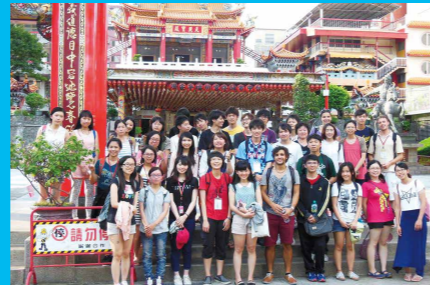
海外体験プログラム