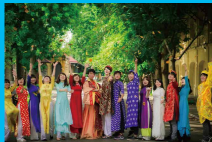
スタディアブロードプログラム (SAP)