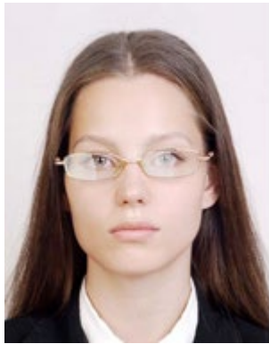
Lighting is reflected in glasses 照明が眼鏡に反射している