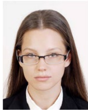
Glasses frame covers eyes 眼鏡のフレームが目にかかっている