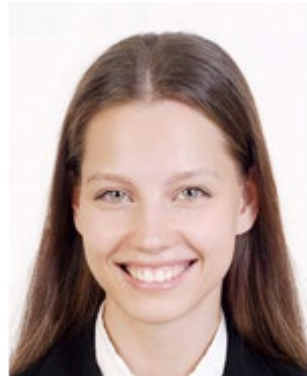
Expression differs greatly from normal expression 口を大きく開けて笑っている