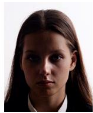
Shadow on face 顔に影がある