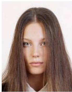
Eyes are obscured by hair 前髪で目元が見えない