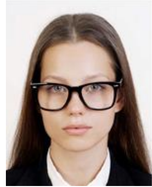
Glasses frame is exceedingly large 眼鏡のフレームが非常に太い