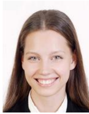
Expression differs greatly from normal expression 口を大きく開けて笑っている