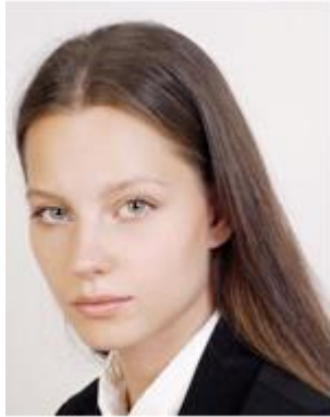
Body is angled 体が傾いている