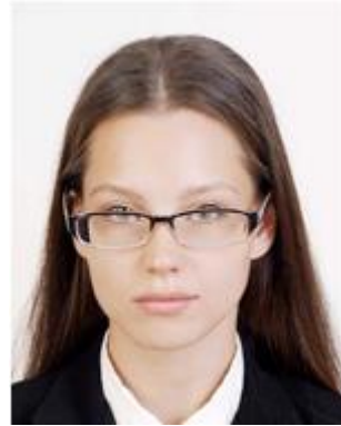
Glasses frame covers eyes 眼鏡のフレームが目にかかっている