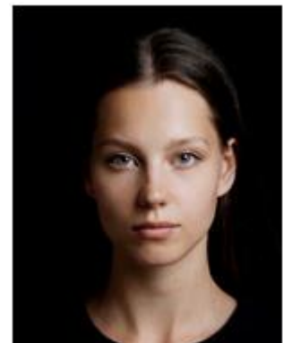
Dark background color makes it difficult to determine outline 背景が暗すぎる