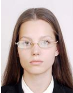
Lighting is reflected in glasses 照明が眼鏡に反射している