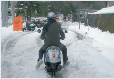
降雨降雪・凍結 スピード注意 スリップ・転倒注意

自転車やバイクの運転には常にさまざまな危険が伴います。 また雨天時や冬の積雪・凍結など路面状態が悪いときには、坂道だけでなく平地でも転倒など事故が起こりやすくなります。 交通事故から身を守るためにも、交通ルールを守り、無理の無い運転を心掛けましょう。