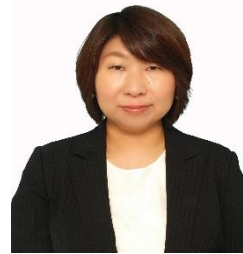
水曜：坂本准教授 11時～13時 欧州